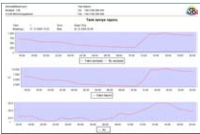
Zamana bağlı grafiksel analiz

Sistem Pompalardan satış bilgilerini, Tank Seviye Ölçüm Sisteminden ise yakıt seviyesi, su seviyesi, sıcaklık ve opsiyonel olarak yoğunluk bilgilerini toplar. Bu işlem için herhangi bir üreticinin tank seviye ölçüm sistemi kullanılabilir. Sıcaklık kompenzasyonu ile Sistem akaryakıtların net hacimlerini hesaplar. Size akaryakıt hareketlerini şeffaf bir şekilde izlemek kalır. Artık İstasyonunuzu kontrol etmek hatta optimizasyonunu sağlamak sizin elinizdedir. NMS'in (Network Management System - Merkezi Ağ Yönetim Sistemi) de sisteme entegrasyonu ile istasyonlarındaki tüm akaryakıt hareketleri tek bir merkezden yönetilme ve değerlendirilme imkanına kavuşur.