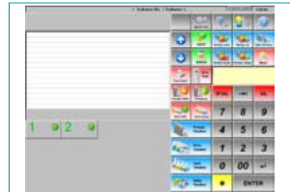
TMS30 Kullanıcı arayüzü

Tank seviyeleri ve satışların devamlı izlenebildiği pencerede sistem önceden ayarlanan kritik değerlere ulaşıldığı takdirde kullanıcıyı uyarır. Tüm bilgiler tablo veya grafik olarak görüntülenerek bir bakışta istasyondaki tüm hareketlerin izlenmesi amaçlanmıştır.